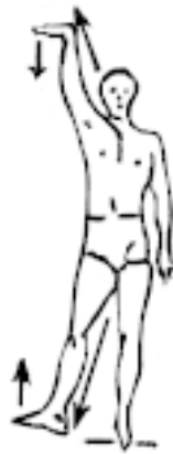
Упр. 2: Потягивание левой стороны тела – ЛЕВАЯ РУКА-ЛЕВАЯ НОГА: