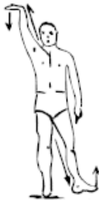
Упр. 4: Потягивание левой диагонали тела – ЛЕВАЯ РУКА-ПРАВАЯ НОГА: