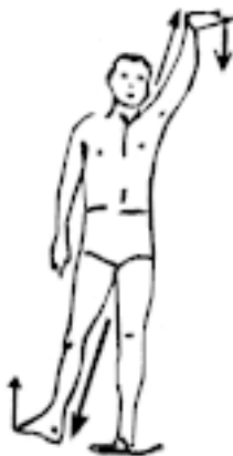
Упр. 3: Потягивание правой диагонали тела – ПРАВАЯ РУКА-ЛЕВАЯ НОГА: